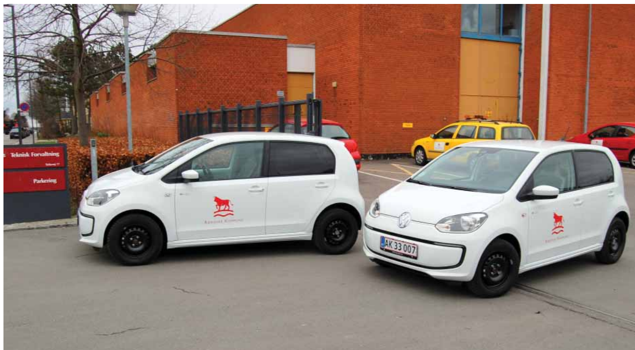
To af Teknisk Forvaltning's elbiler

Stort set alle handlingerne i planen er igangsat eller igangsættes i løbet af 2015. Det omfatter blandt andet samarbejde med boligselskaber, udarbejdelse af informationsmateriale og klimatilpasning i lokalplaner. Klimatilpasning indtænkes også i driftsopgaver. Et eksempel på dette er, når Teknisk Forvaltning planlægger og renoverer legepladser på skoler og institutioner. I den forbindelse bruges der overvejende permeabelt faldunderlag fremfor sand-faldunderlag. Der er mindre vedligehold ved permeabelt