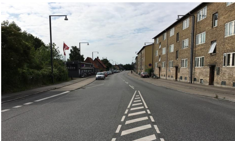
Figur 1. Hvidovrevej set fra Damhustorvet mod syd.

Rødovre Kommune har oplyst, at det på baggrund af trafikmængden ikke er muligt at ensrette vejen, og der skal således opretholdes dobbeltrettet trafik. Der er bus i rute på strækningen.