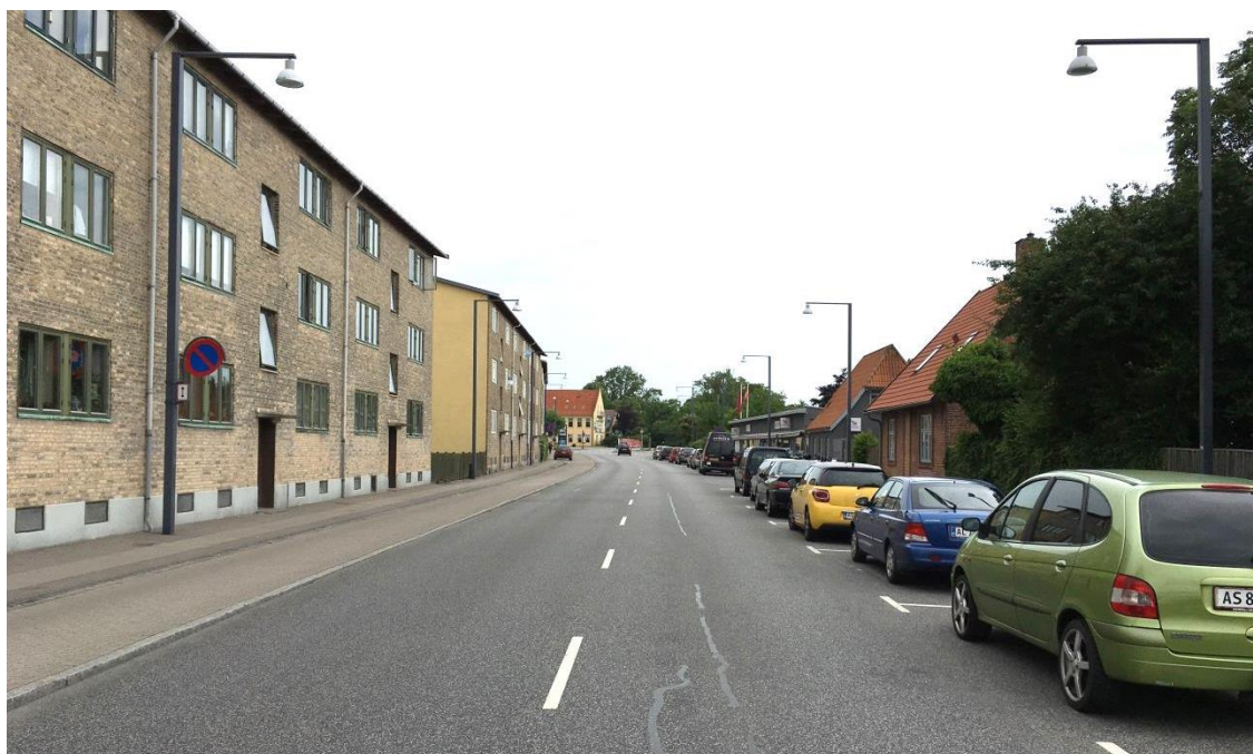
Figur 2. Hvidovrevej set fra Vedstedvej mod nord.

Der er i dag i alt 20 afmærkede p-pladser på delstrækningen mellem Roskildevej og Vedstedvej.