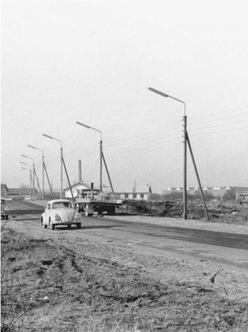
Industrien lå ret spredt på Hvidsværmervej i 1960'erne