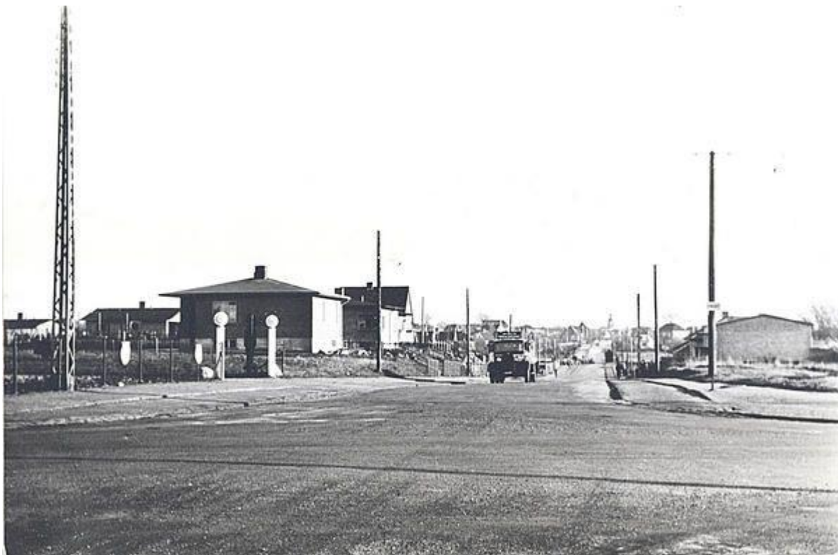
Jyllingevej (tidligere Ledagervej). Tværliggende vej: Rødovrevej. 1937