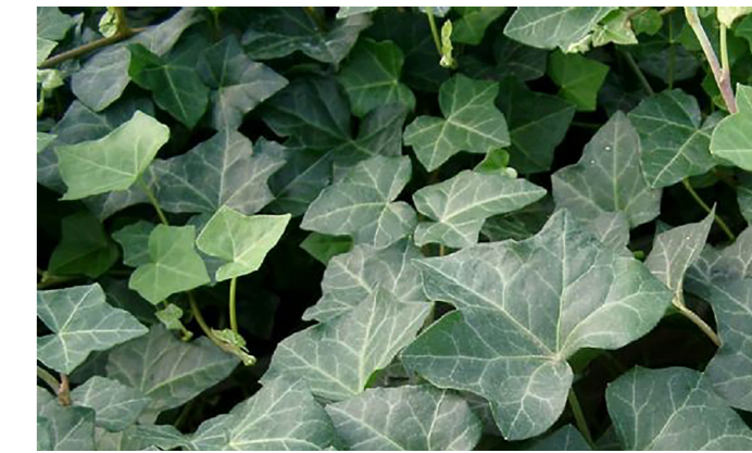
Støjvæggen begrønnes med klatreplanter.