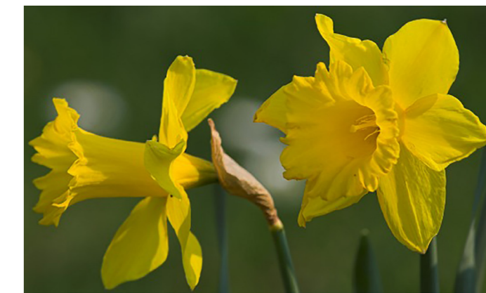
For en lang blomstringsperiode plantes forskellige sorter af påskeliljer.