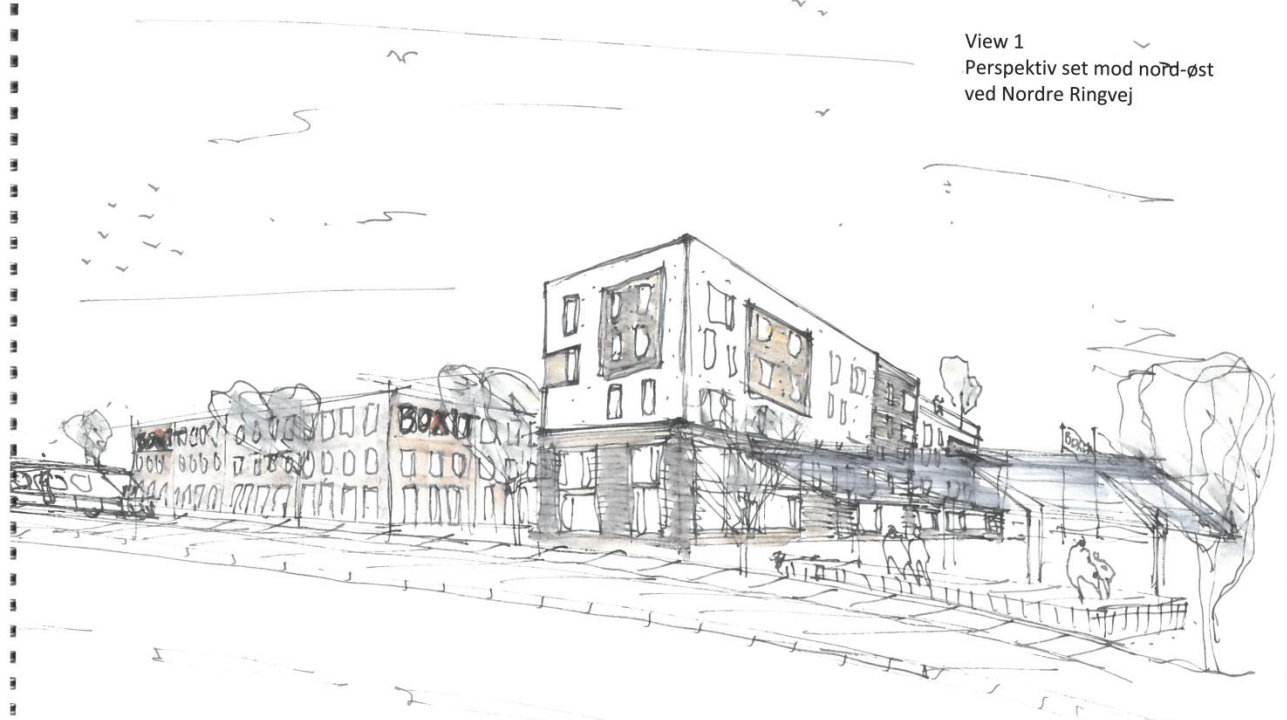
PERSPEKTIV SET MOD NORD-ØST VED NORDRE RINGVEJ

Rambøll Arkitektur & Integreret Design Dato: 03.11.2017 - chr