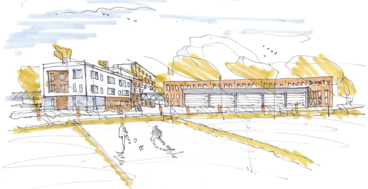
PERSPEKTIV SET MOD SØD VEST SLOTSHERRENVEJ 400 · 2610 RONDHUSE

Rambøll Arkitektur & Integreret Design Dato 03.11.2017 - chr