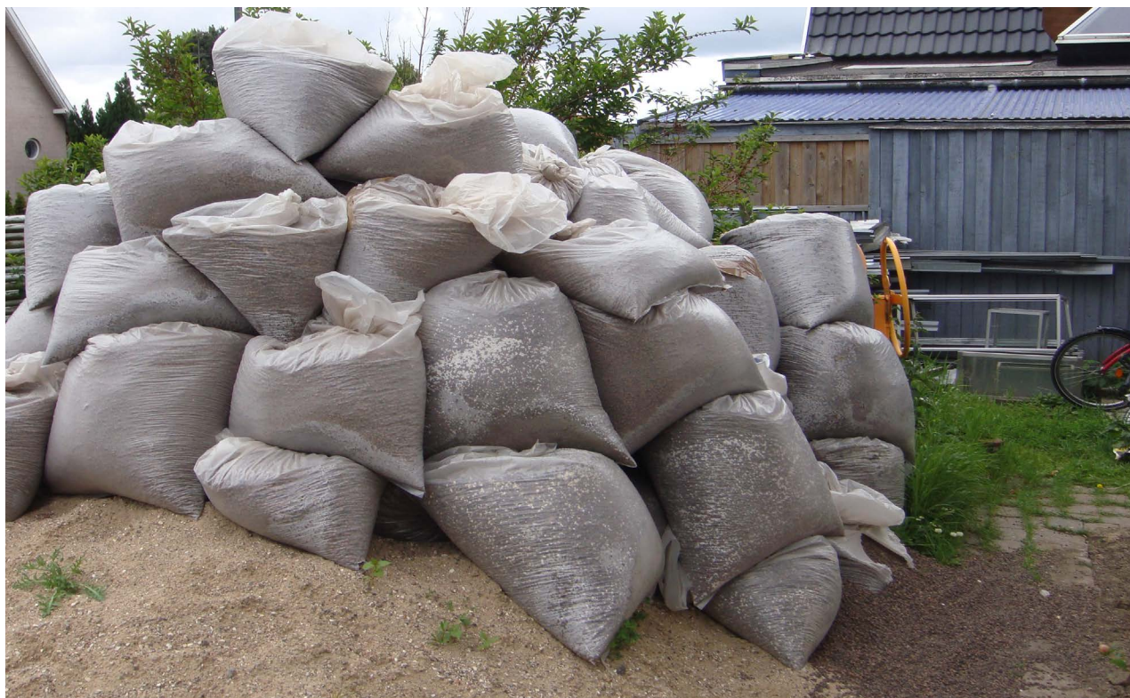
Byggeaffald - isoleringsmateriale i sække giver mulighed for redesteder og hindrer en effektiv rottebekæmpelse.