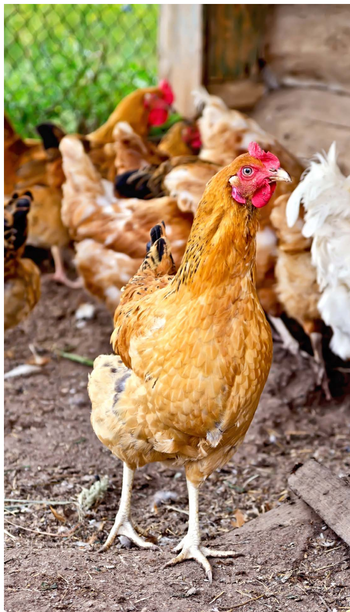
Hønseshold kan tiltrække rotter.