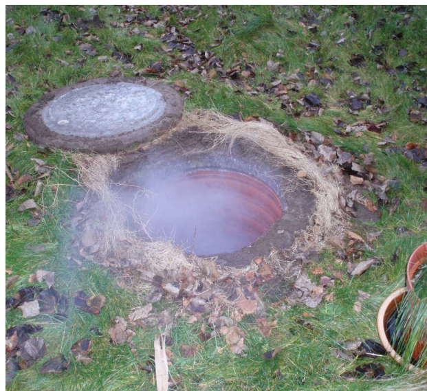
Positiv røgprøve ved kloakbrud.

Udover selve bekæmpelsen bruger vi ca. et årsværk på kontakt med borgere, planlægning, tilsyn og håndhævelse af lovgivningen.