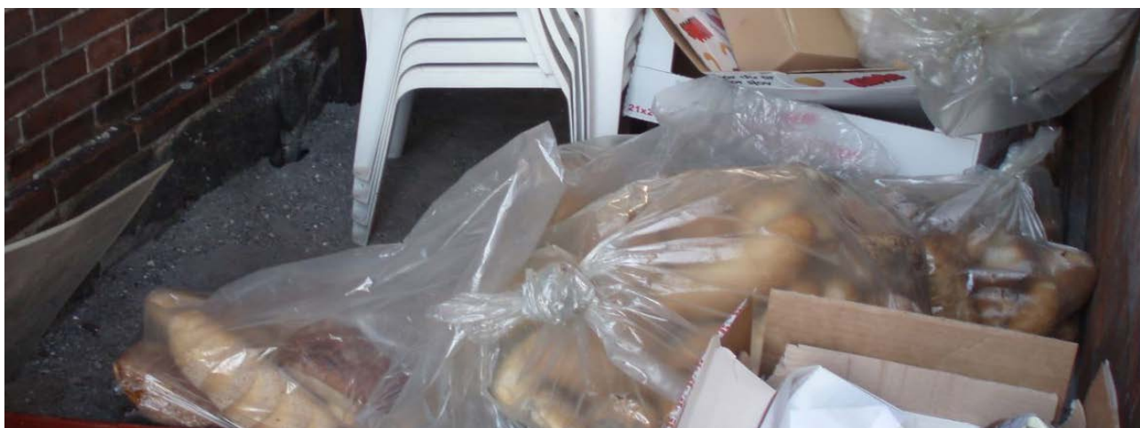
Brød affald smidt på jorden.