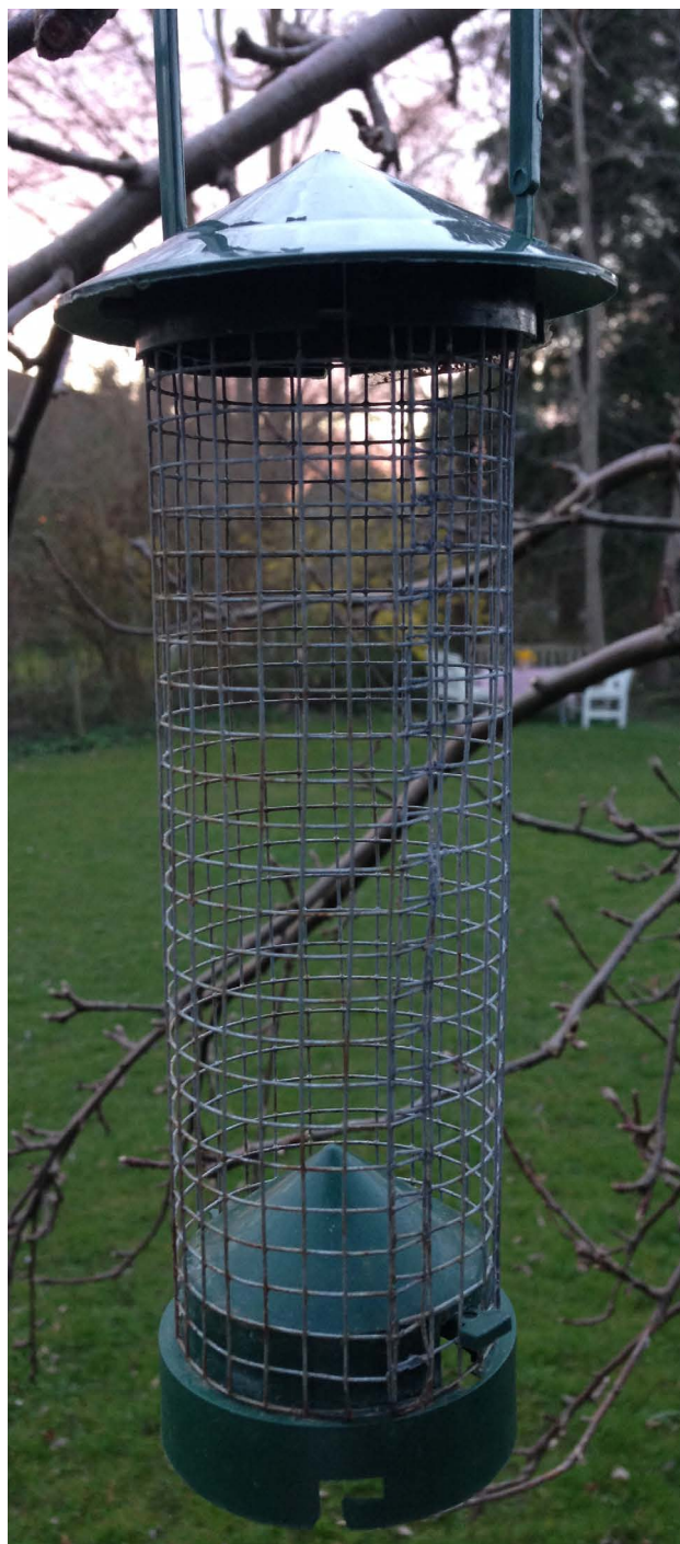
Fuglefodring kan give anledning til rotter.