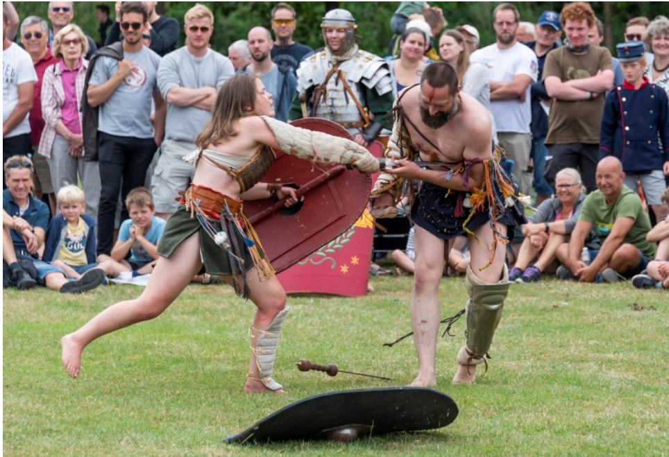
Romersk gladiatorkamp var et af de store hit på Krigshistorisk Festival 2018