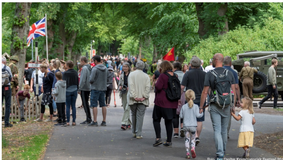
Stemmingsbillede fra Voldgaden

Krigshistorisk Festival blev afholdt for anden gang på Vestvolden den 16.-17. juni 2018.