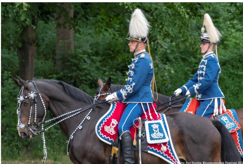
Fra Forsvaret deltog Gardehusarregimentets Hesteskadron i 2018

De gode resultatet skyldes ikke mindst en flot og engageret indsats fra både de knap 400 deltagende aktører, der bl.a. med ultrakort varsel meget fornemt improviserede sig ud af det totale afbrændingsforbud, der blev udstedt torsdag den 14. juni 2018 om aften, men også fra vores lokale frivillige fra bl.a. ROG og Avarta, der leverede en formidabel indsats i forplejningsboderne.