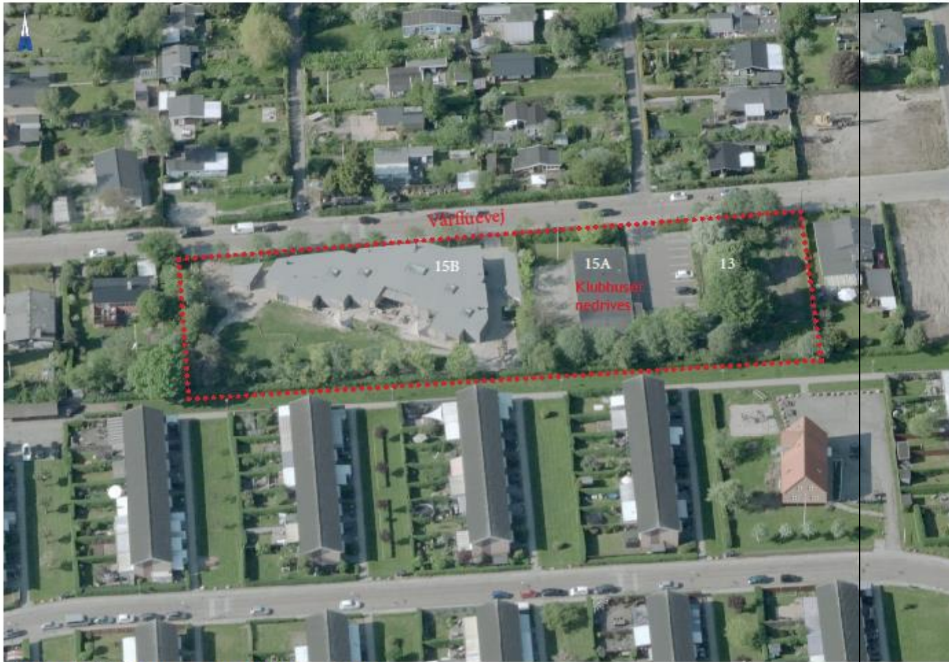
Skråfoto fra GIS af daginstitutionen og klubhuset set fra syd

Kort over lokalplanområdet – eksisterende forhold