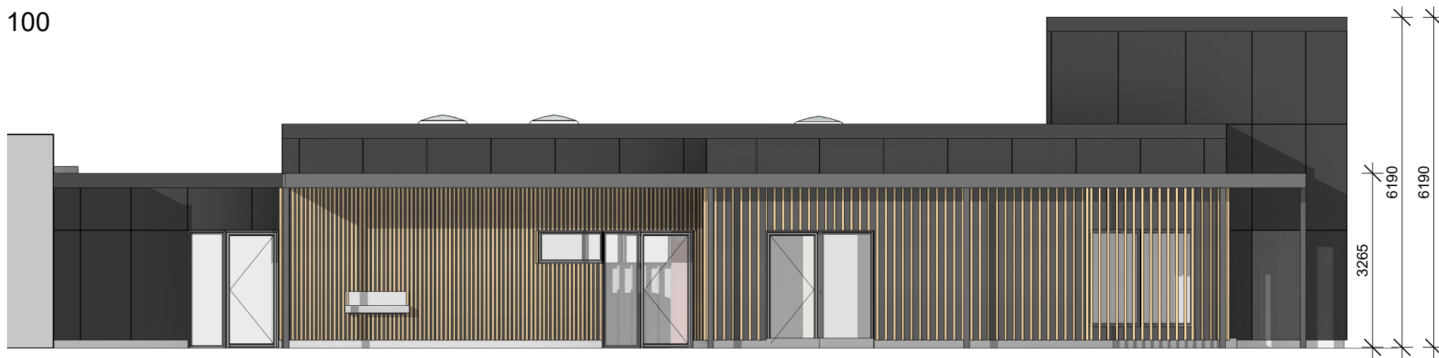
Vest 1 : 100