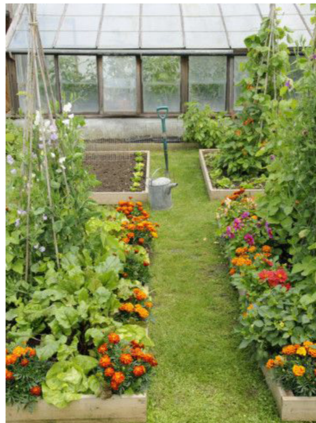
Højbede der danner rum og smalle stier