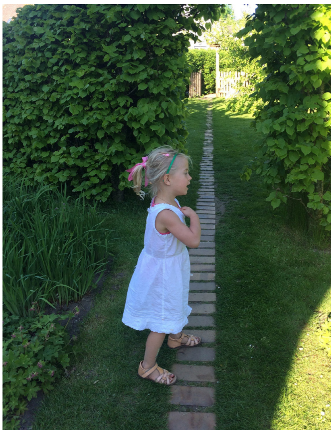
Smalle sekundære stier med klinker