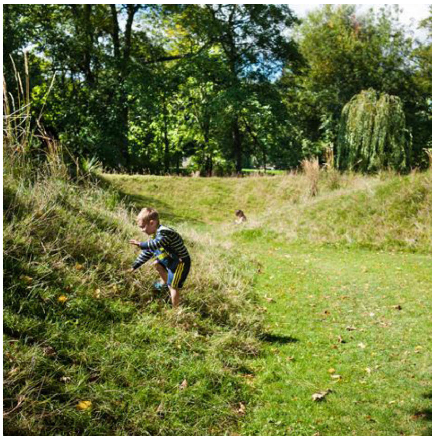
Terrænbakker som ruminddelere