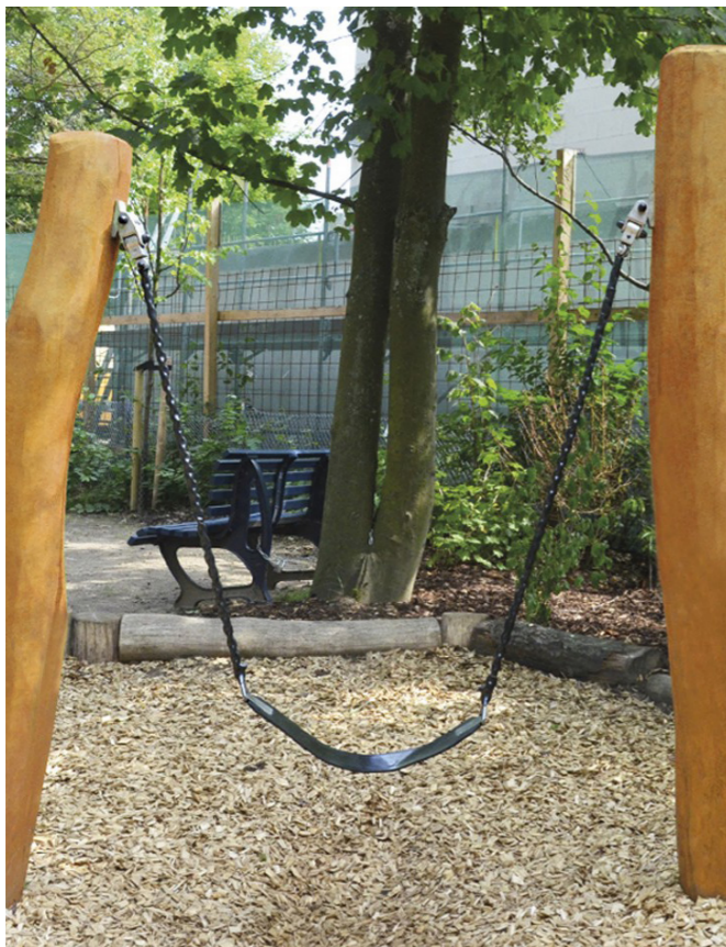
Nye saddelegynger for de 1-3 årige