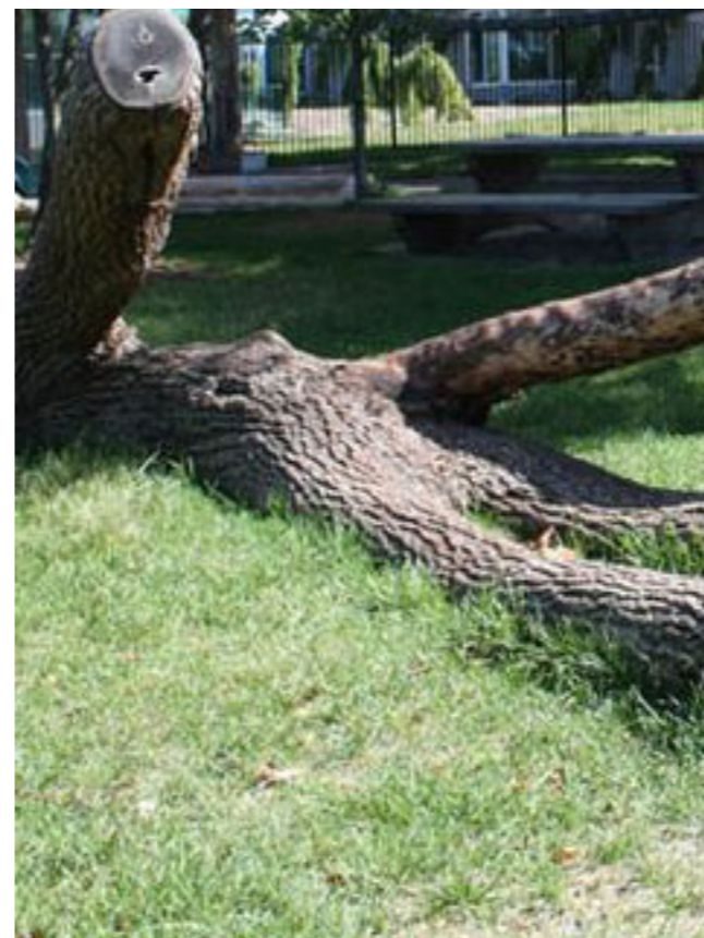
Træstammer og træstubbe