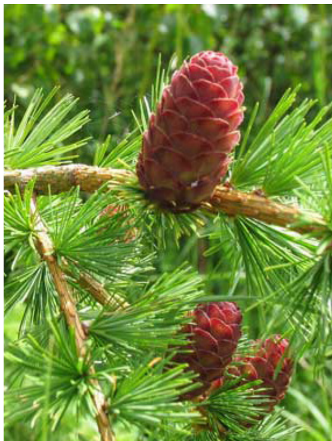
Varianter af nåletræer