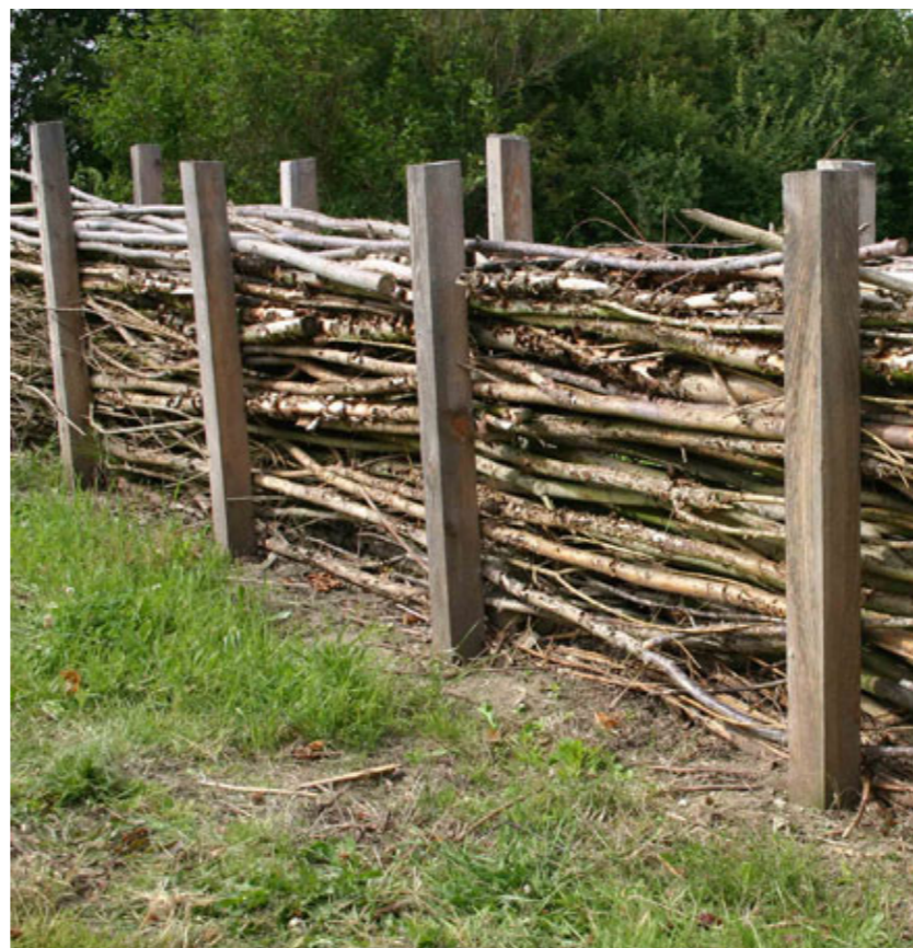
Kvashegn som indramning af laboratoriet