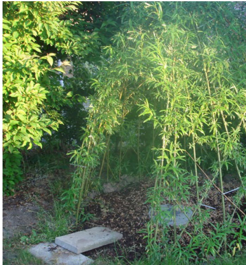
Rumlige huler i beplantningen