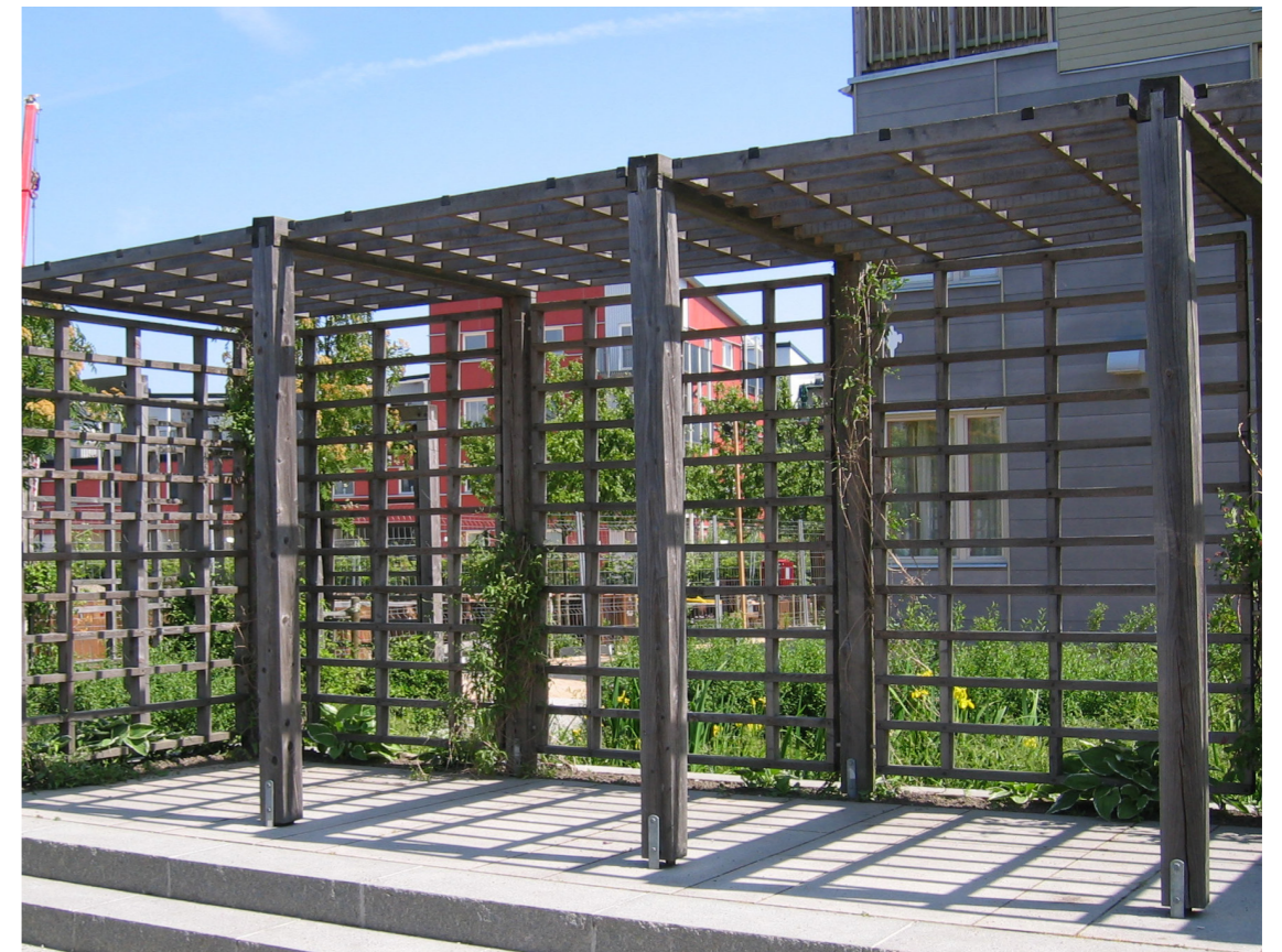
Pergola med overdækning