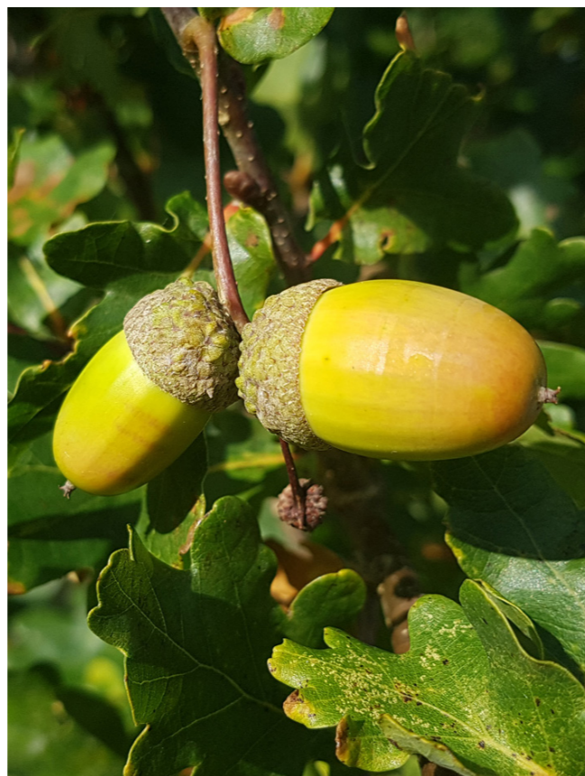
Varianter af løvtræer