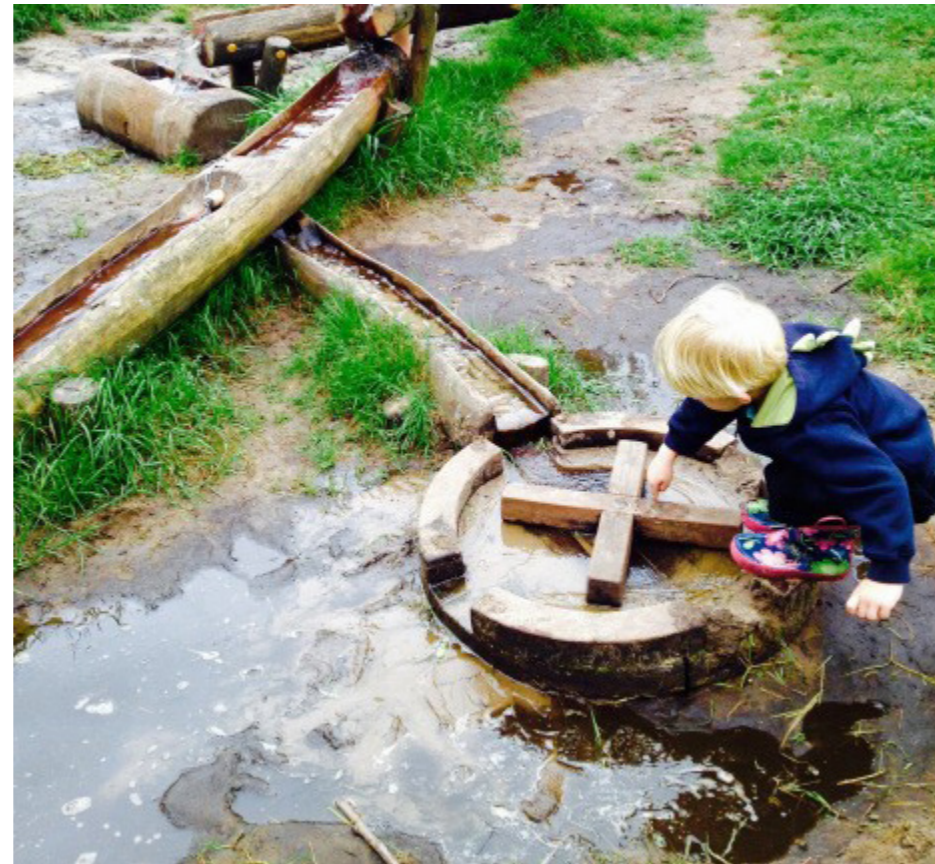
Mulighed for vand fra udendørs vandpost