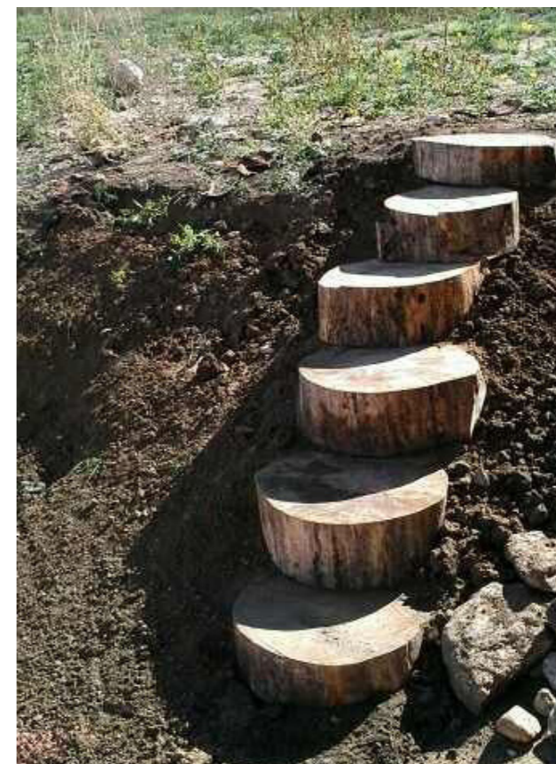
Høje og udfordrende trin op til toppen