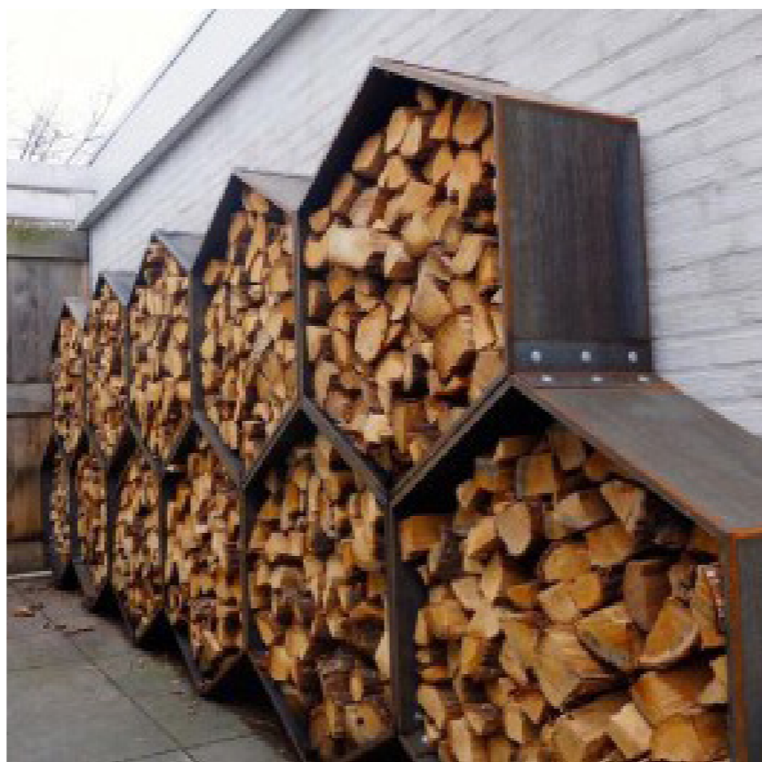
Brændestabel - sekskantet konstruktion i træ