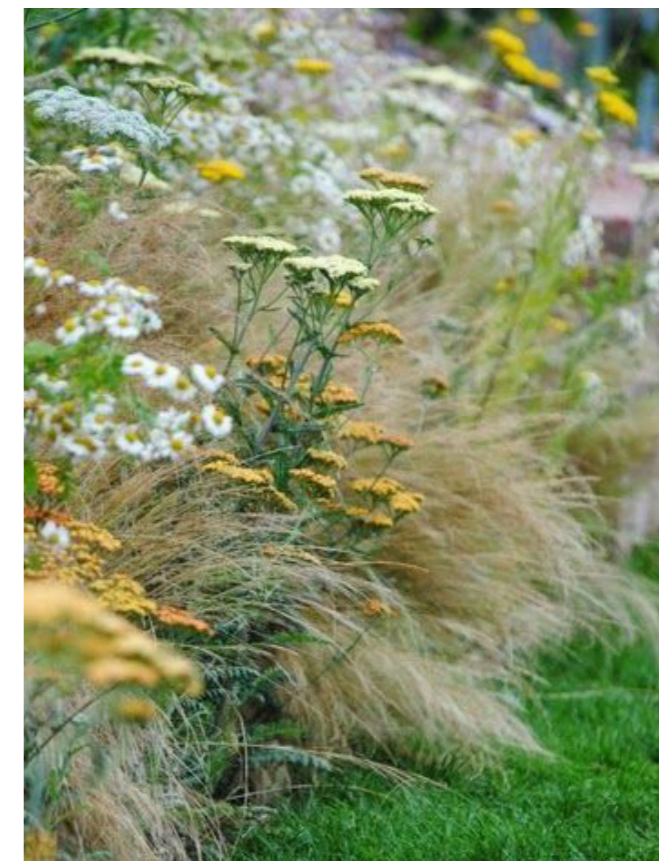
Høje græsser med plads til blomster og insekter