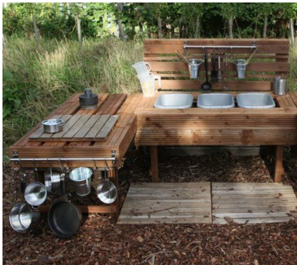
Udekøkken i børnehøjde