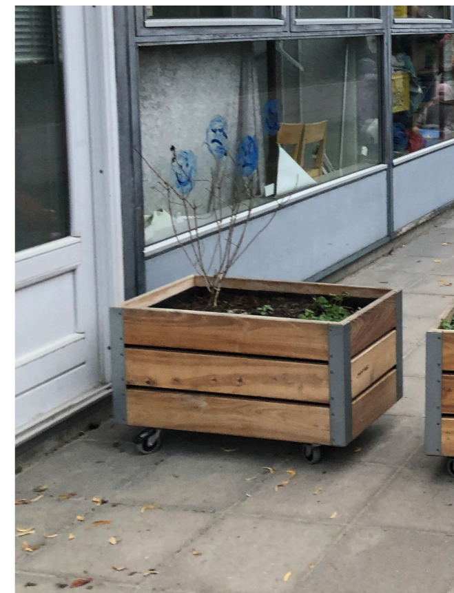
Terrasser med flisebelægning svarende til eksist.