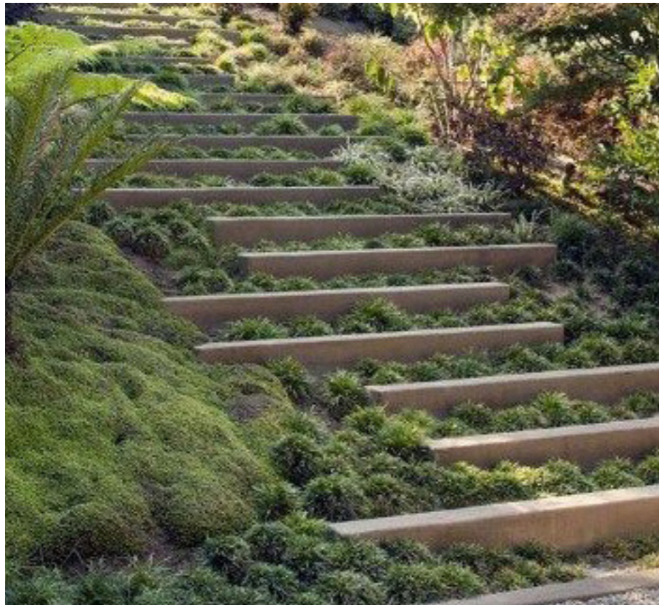
Mini amfi med sveller på terrænbakke