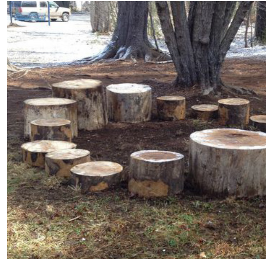
Træstubbe som mobile samlingspladser