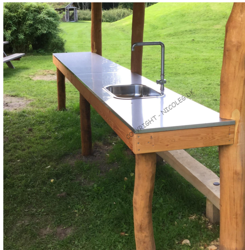
Udekøkken i voksenhøjde (der bliver ikke etableret udendørs vandhane)