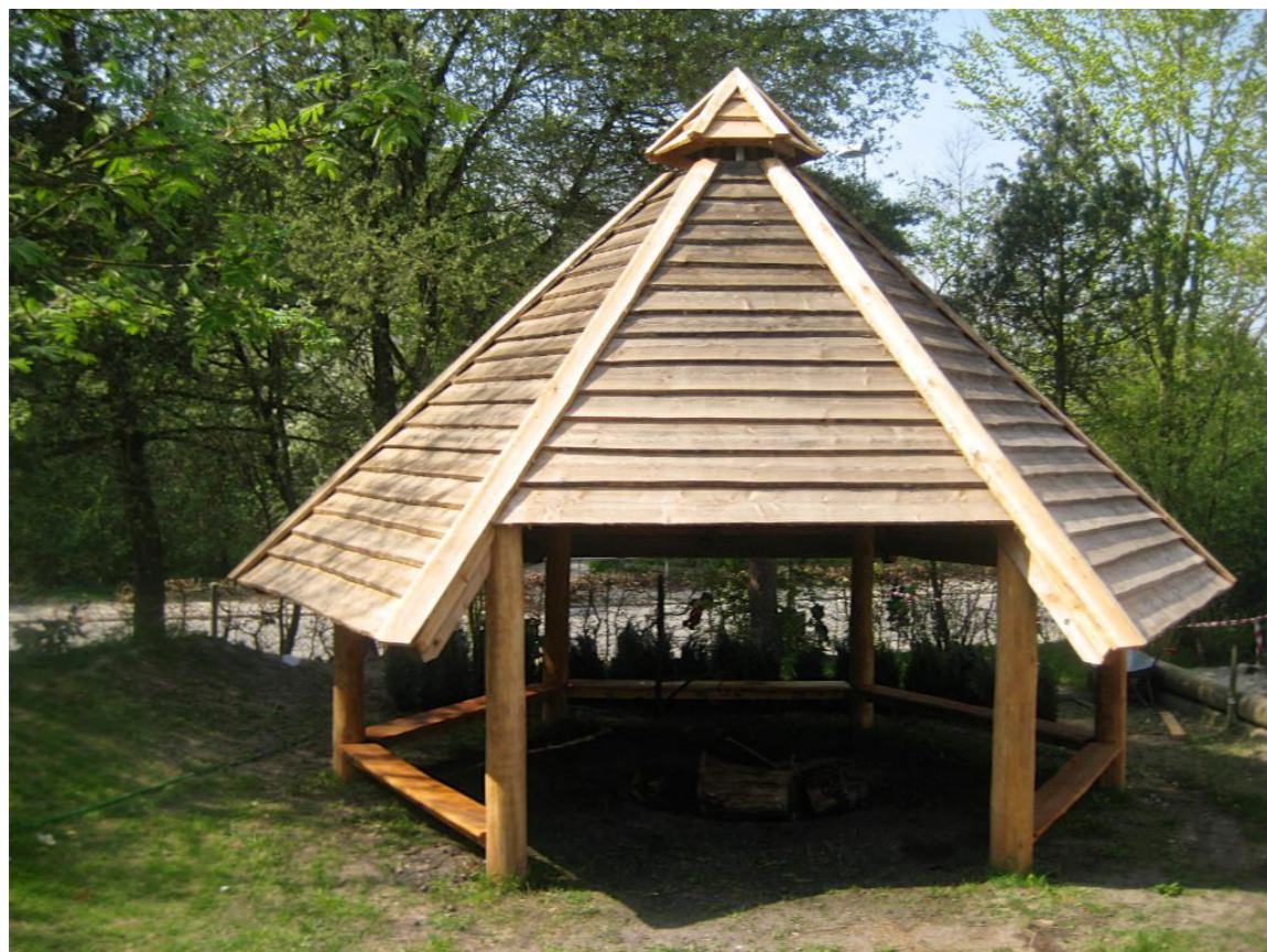
Sekskantet grillhytte med siddepladser