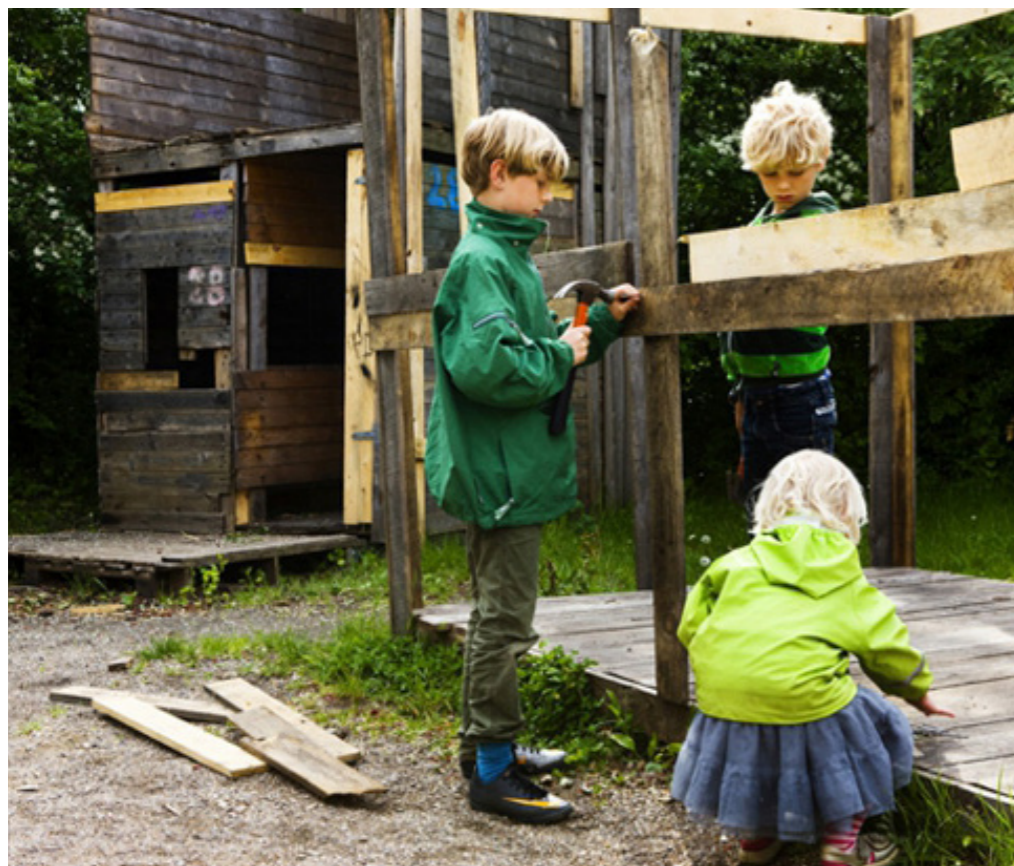
Værkstedsmiljø med plads til eksperimenter og undersøgelser