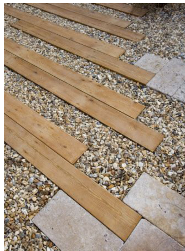
Felter med variation af overflader