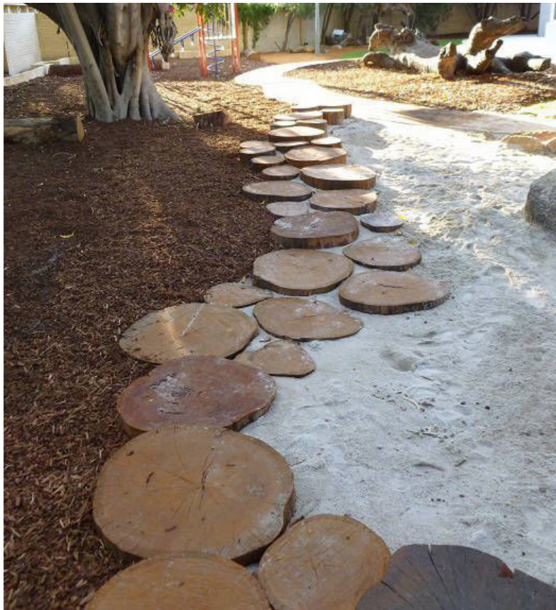
Kantning med træstubbe