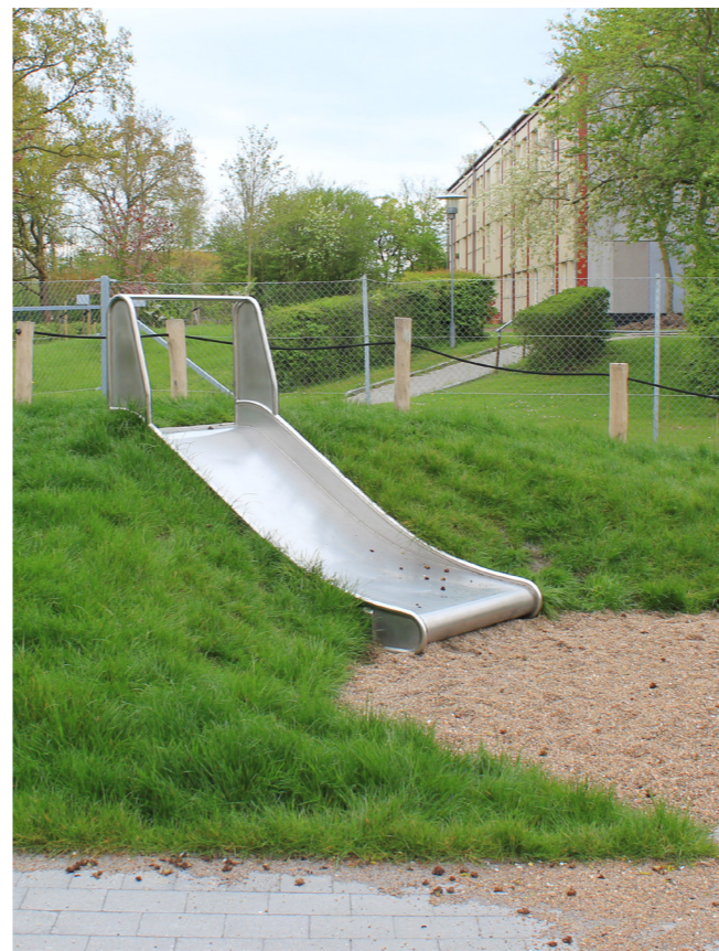
Rutsjebane for de 1-3 årige