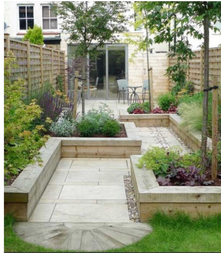
Brede siddekanter omkring primære plantebede