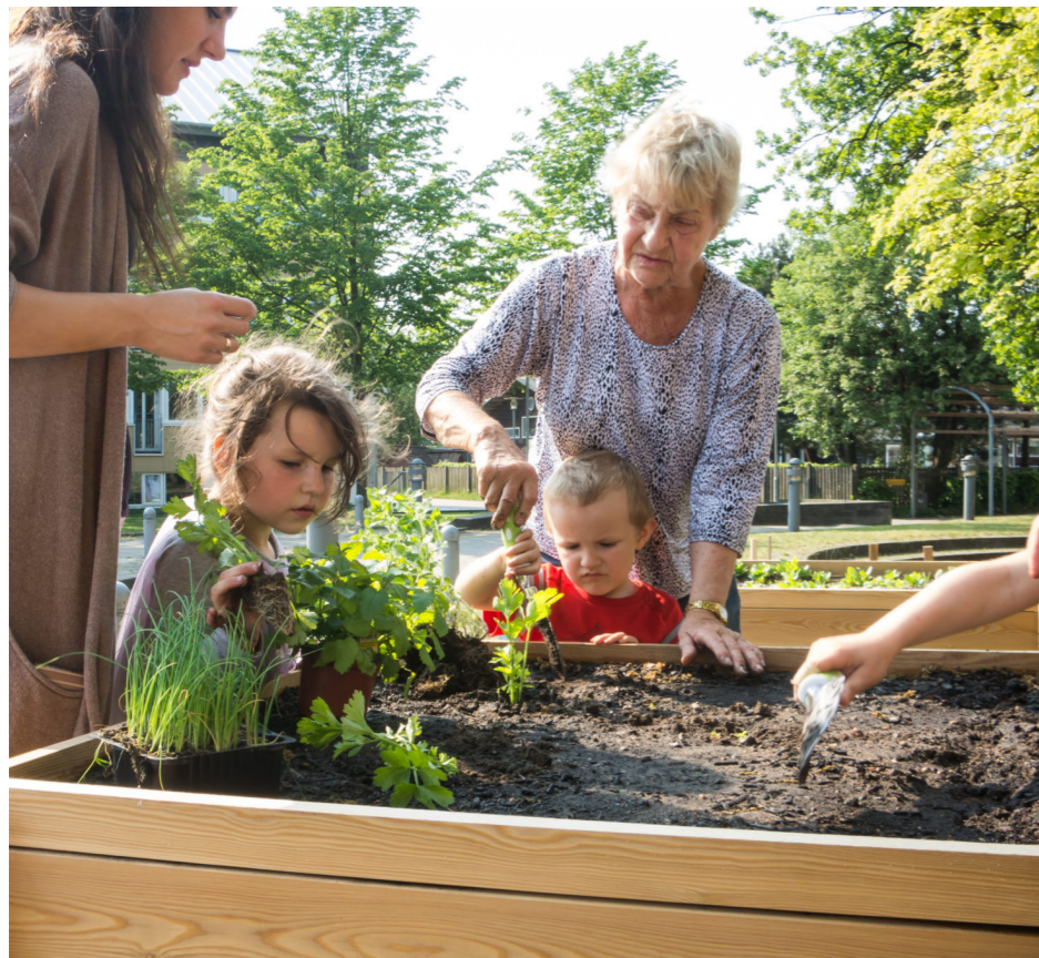
Højbede med urter og grøntsager i øjenhøjde.