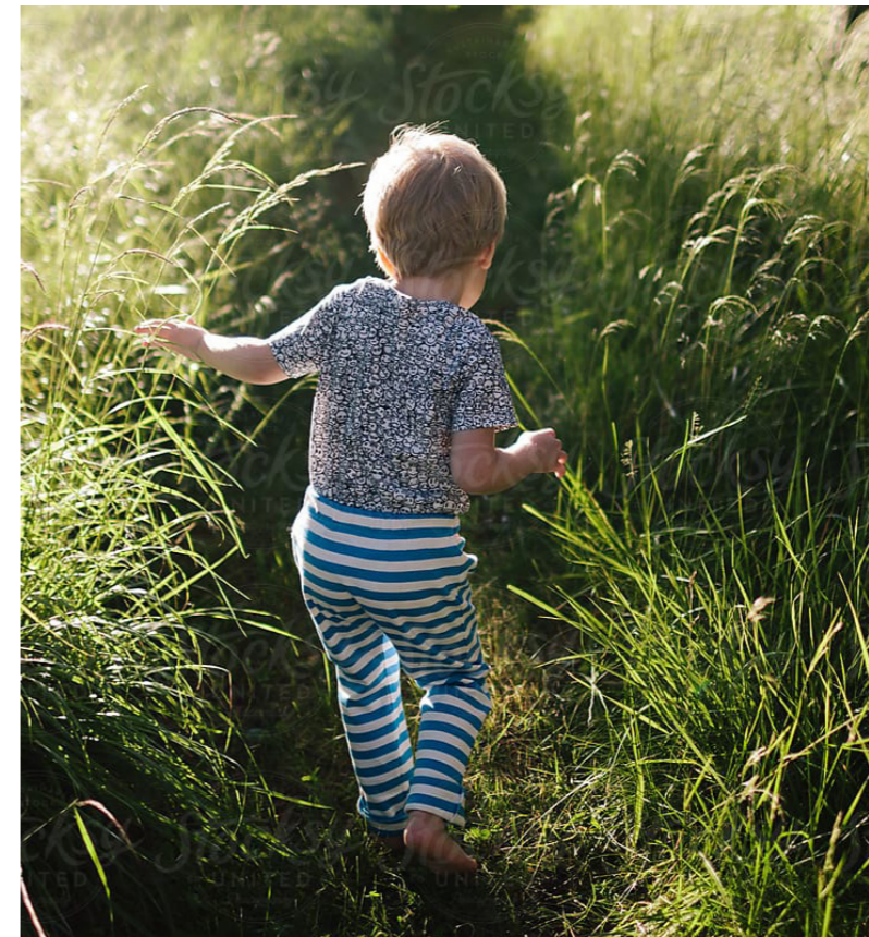
Vildnis af høje græsser