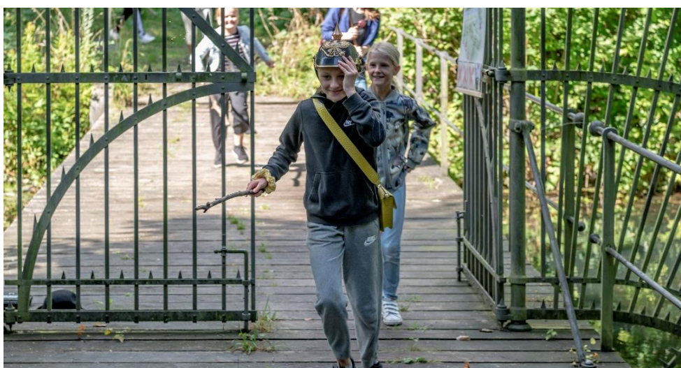
Stemningsbillede fra Rødovredagen omkring Ejbybunkeren i september 2020.

I begyndelse af september gennemførte vi, trods en række indskrænkninger i programmet umiddelbart op til, en fin og hyggelig dag i og omkring Bunkeren til vores del af årets decentrale Rødovredag.