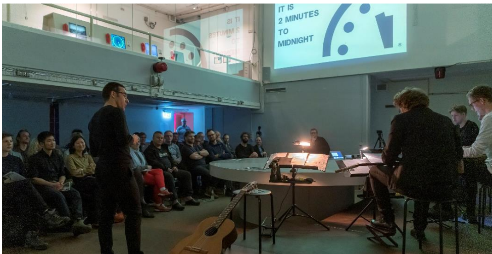
Guitar-ensemblet CRAS på plads i operationsrummet i Ejbybunkeren i januar 2020, mens vi stadig måtte sidde tæt.

Det blev en noget anderledes museumsoplevelse end den, vi plejer at give vores gæster, men det var en fin og meget stemningsfuld aften.