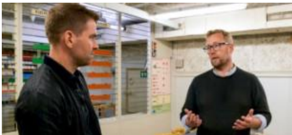
Museumslederen fortæller koldkrigshistorie i Civilforsvarets kommandocentral under Rødovre Bibliotek.

En række af opslagene knyttede an til de to afsnit af dokumentarprogrammet "Atombomberne over Danmark" på DR2 og dr.dk, som museumslederen medvirkede i.