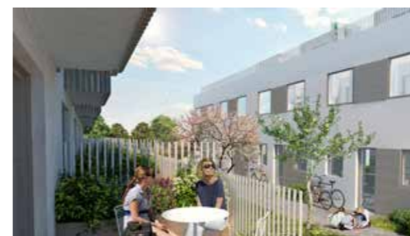
De hævede terrasser med adgang til have