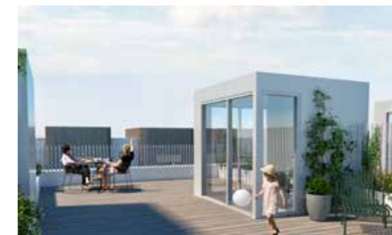
Tagterrasserne med udsigt