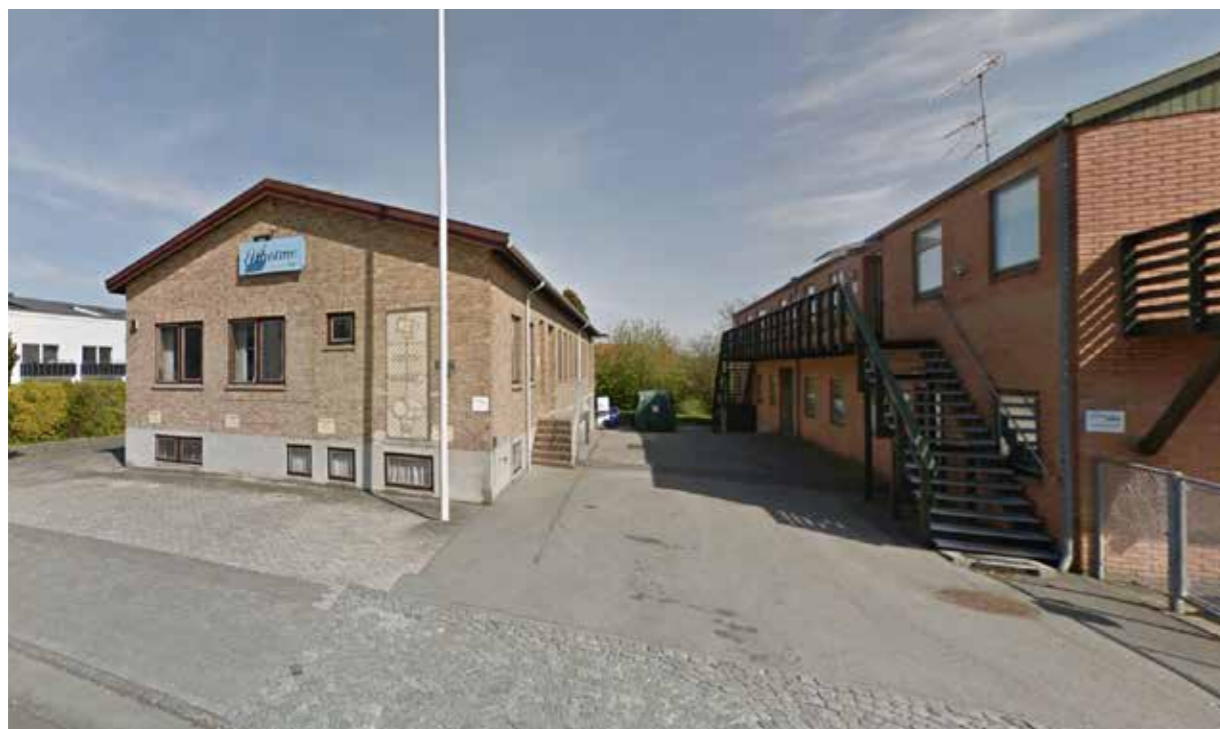
Det grå rum mod Højnæsvej