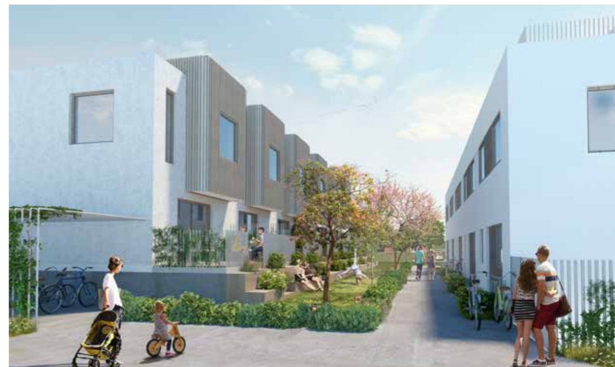
Det grønne rum mellem bygningerne