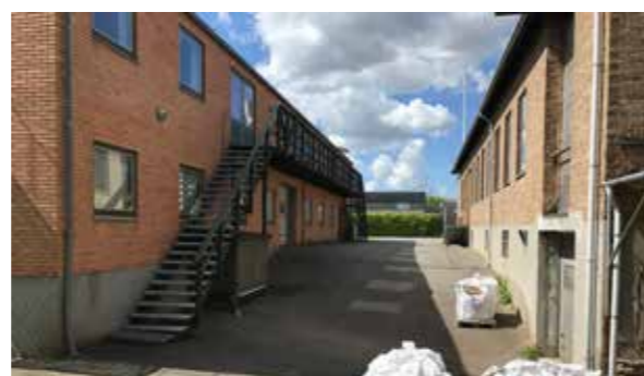
Rampen mellem bygningerne