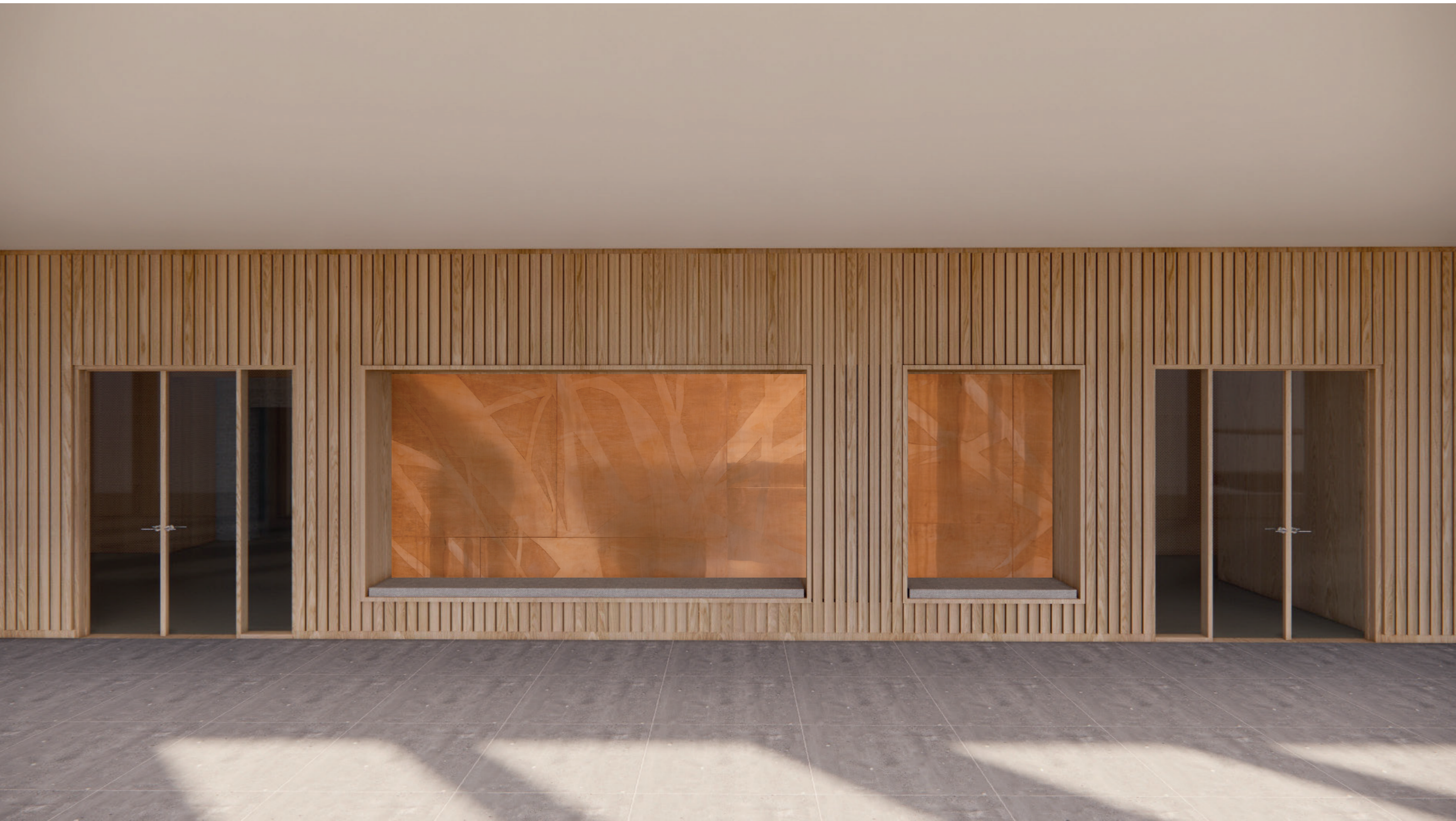
SILKETRYK dirkete på pladerne