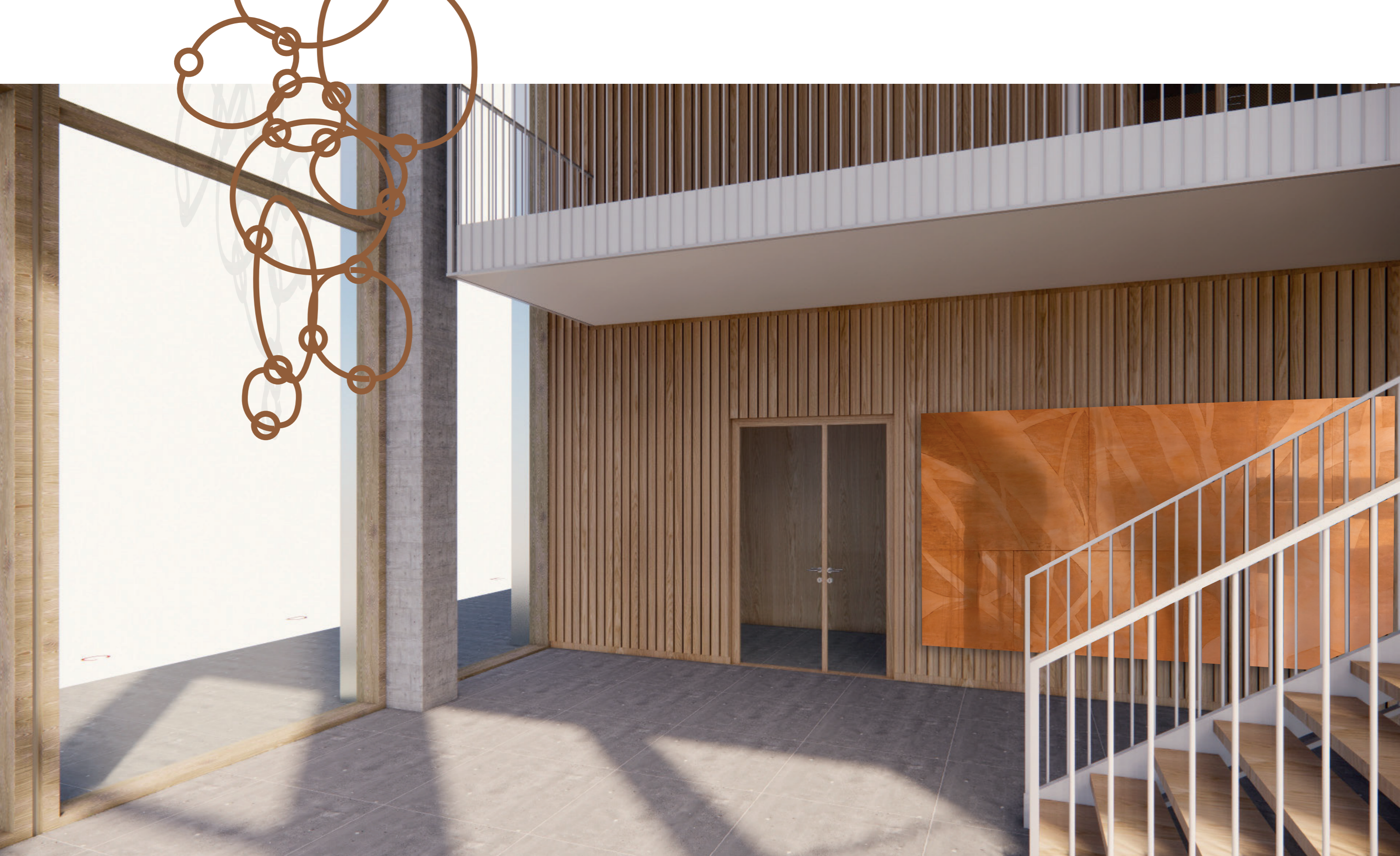
Kobber som medie forandring i lys og tid