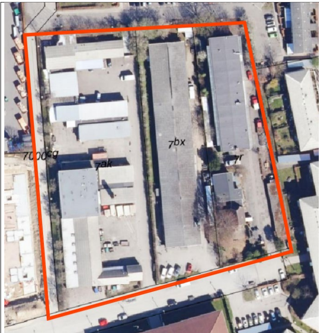
Billede 2: Lokalplanområdet– Eksisterende forhold