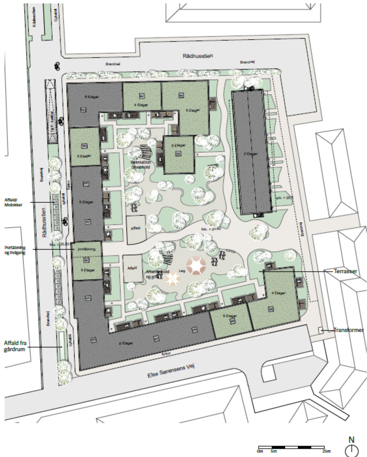
Billede 3: Situationsplan for den nye karrébebyggelse og med den bevarede industribygning i 2 etager